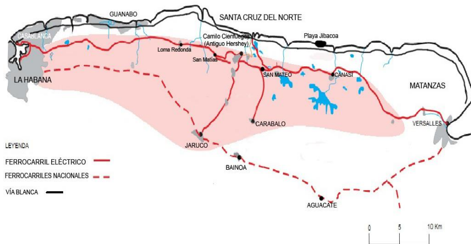
Figura 2. Ubicación geográfica del trazado ferroviario.