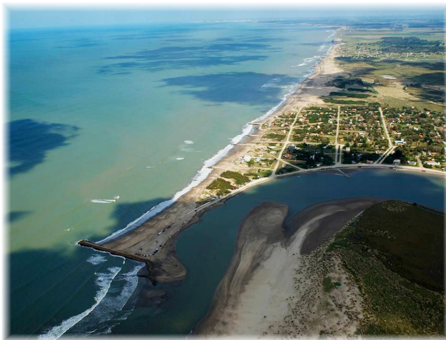
Figura 3. Vista aérea entrada albufera Mar Chiquita.

Naturales (Ley 10907) categorizándola como Reserva Natural de Uso Múltiple. Por sus condiciones físico-naturales es considerado un humedal. Estos ecosistemas son ampliamente reconocidos por su fragilidad ecológica por una parte, pero también por los beneficios ecosistémicos que ofrecen a la humanidad. Una de las problemáticas que llama la atención sobre estos ecosistemas es su fragilidad y el bajo porcentaje que representan estos ambientes a nivel global.