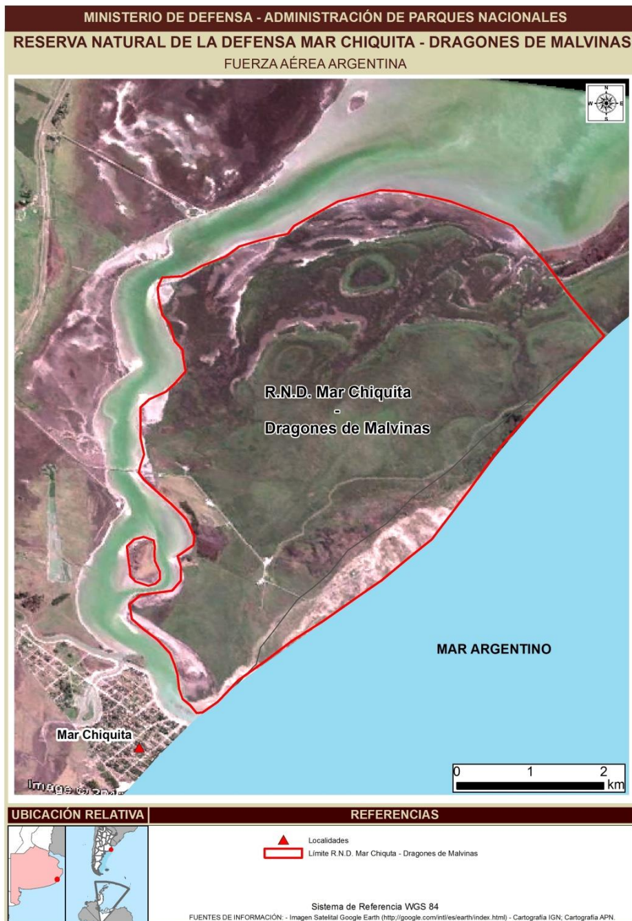
Figura 2. Foto satelital de la reserva.

Desde abril de 1999 es Reserva Mundial de la Biosfera dentro del Programa MAB (Programa del Hombre y la Biósfera) de la UNESCO y, en Febrero de 1999 el gobierno de la provincia de Buenos Aires la incluyó en el régimen de Parques y Reservas