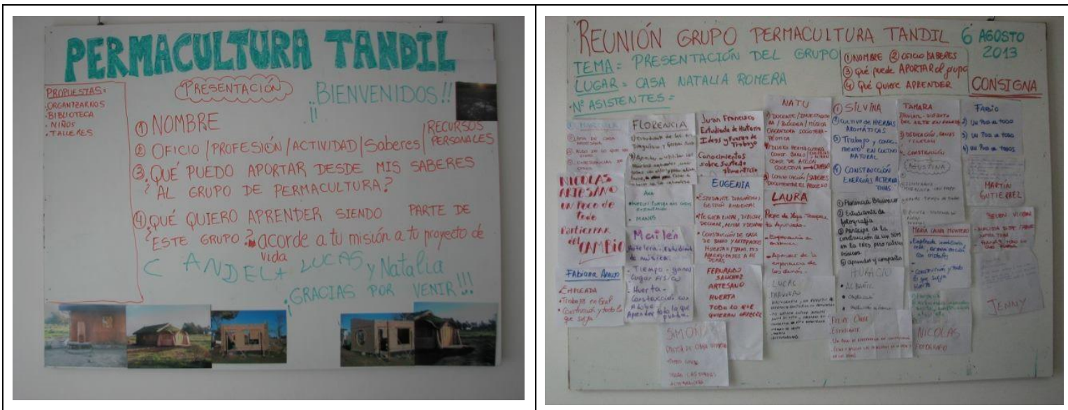
Figuras 3. Síntesis del taller del 1er encuentro Etapa 2 del Grupo Permacultura Tandil 2013.

En los encuentros se hacía hincapié en transmitir los fundamentos filosóficos y teóricos de la práctica permacultural, ya sea asociados a la producción de huertos o la construcción, aunque casi siempre se generaban otros espacios donde se compartían vivencias, anécdotas y