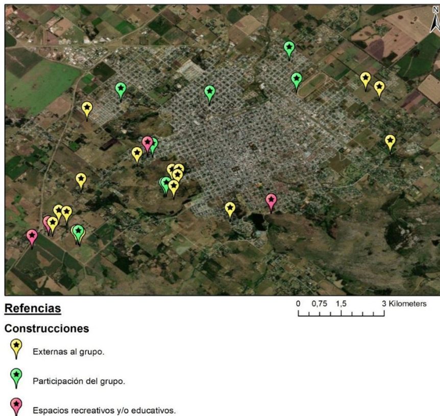
.Figura 2. Expresión territorial de acciones permaculturales en Tandil