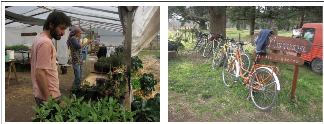
Figuras 4. Prácticas de cultivos y jardines orgánicos.