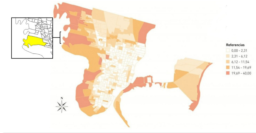
Figura 2. Mapa de Hogares con NBI (%) según radio censal CNPhyV (INDEC, 2010)

La zona donde está emplazado el barrio es la intersección entre el denominado Camino Viejo a Esperanza y calle Espora. Es una zona con índices de calidad de vida muy bajos que se traducen no solo en las condiciones socioeconómicas de los grupos que allí viven, sino también en las condiciones ambientales de lugar 13 .