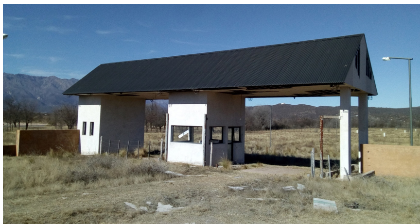
Figura 4. Ingreso abandonado del loteo Cimas de Nono Fuente: fotografía propia, agosto 2019

(...) la demanda de tierras en nuestro Valle de Traslasierra para residencia y para la colocación de inversiones turísticas ha potencializado los negocios inmobiliarios. Los actores sociales de éste sector, en ciertos casos, evalúan la posibilidad de efectuar la conversión de tierras rurales a tierras urbanas, obteniendo una enorme rentabilidad y produciendo expansiones urbanas, a veces, no programadas. (Municipalidad de Nono, 2018, p. 17)