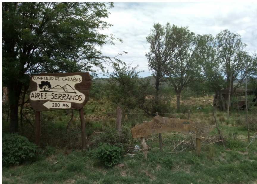
Figura 2. Paraje Bajo el Molino. Terrenos en desuso y avance de la actividad turística

ideas, de encuentro de lo diverso, de gestación de lo híbrido y lo novedoso. En estas localidades, donde convergen trayectorias individuales y colectivas de origen muy diverso, y donde confrontan (con sus matices) formas antitéticas de apropiación de la naturaleza, se conforman situaciones de frontera (Trivi, 2014). Se trata de escenarios de disputa entre territorialidades contrapuestas por recursos y espacios de decisión, donde los sujetos (individuales y colectivos) apelan a su acervo de estrategias para tejer alianzas de duración y objetivos variables, en los que tiene un peso determinante la identificación alrededor de la pertenencia al lugar. De allí la distinción entre nativos y foráneos, vehículo para el choque de intereses, pero también para la elaboración paciente de nuevas realidades políticas.