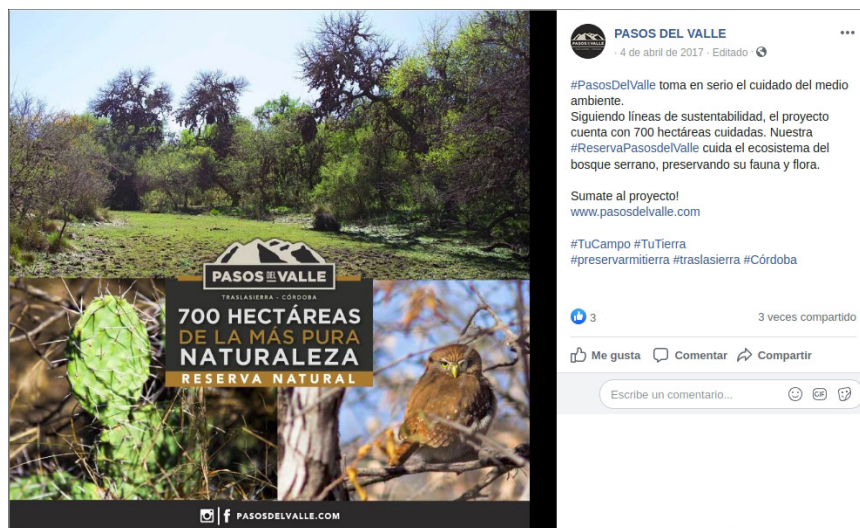
Figura 6. Material de promoción de Pasos del Valle

serrano, acceso rápido a localidades cercanas, son algunos de sus tópicos recurrentes en un lenguaje visual y sensorial común a la promoción turística. La realización de actividades de esparcimiento como trekking , cabalgatas, degustaciones y hasta la presencia de un vivero de especies autóctonas, son integradas al conjunto de estrategias publicitarias del emprendimiento. En consecuencia, el contacto y respeto por la naturaleza que se garantizaría en el predio se vuelve un activo para sus ocupantes y un factor de valorización para sus inversores (figura 6).