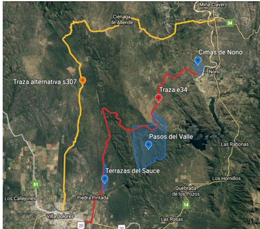
Figura 5. Propuestas para la nueva ruta 34.

que la iniciativa oficial está ligada a la presencia de una serie de emprendimientos inmobiliarios en la zona afectada. Al ya mencionado Cimas de Nono se le sumarían Terrazas del Sauce (cercano a Villa Dolores) y Pasos del Valle, como puntales de un movimiento de valorización inmobiliaria sobre los últimos relictos de vegetación nativa (Retruco, 2019) (figura 5).