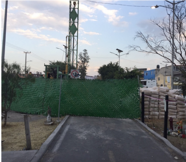
Figura 5. Perforación de pozo en la Quinta zona

El pozo va a resolver muchos problemas en esta zona. [...] El agua del pozo no va a ir directa a la red, se va a construir un tanque elevado [a esto] se llama seccionamiento, pues la idea es que cada colonia tuviera su cisterna y su tanque elevado, porque muchas de las veces el agua va como canal, sin presión. (Jorge, funcionario de SAPASE, comunicación personal, 20 de febrero de 2020)