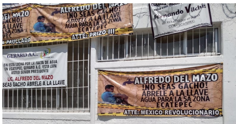
Figura 2. Reclamo al Gobierno estatal sobre los cortes de agua

Las acusaciones ante estas reducciones se presentaron en el territorio de las colonias afectadas (Figura 2). Frente a las protestas vecinales, la administración municipal solicitó al Gobierno federal intervenir. El presidente federal, Andrés Manuel López Obrador, señaló en una de sus conferencias mañaneras que revisaría “cómo está lo del abasto de agua [en Ecatepec]. Es probable que tengan desabasto o que haya lo que se conoce como tandeo [abastecimiento intermitente]”, además, exhortó a la Comisión Nacional del Agua, para supervisar el suministro y recomendó al gobierno estatal a no utilizar el recurso como herramienta política, especialmente en el contexto de la crisis sanitaria (Revisará AMLO recorte de agua [...], 2020).