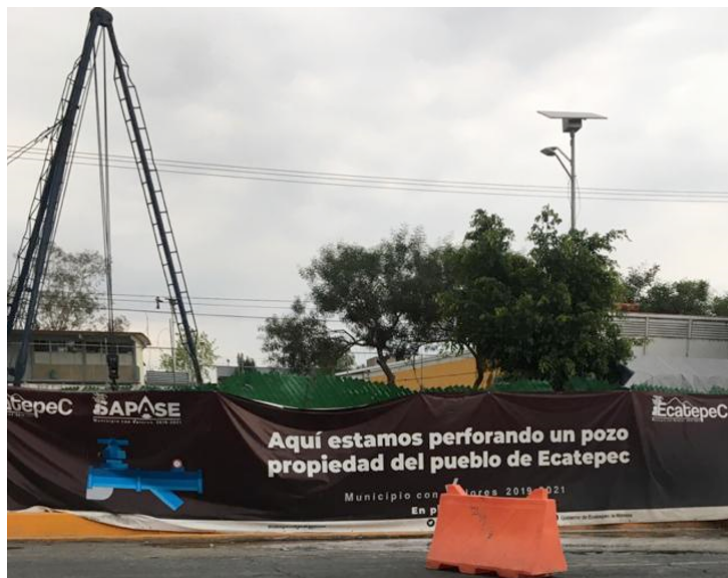
Figura 6. Perforación de pozo en la Quinta zona