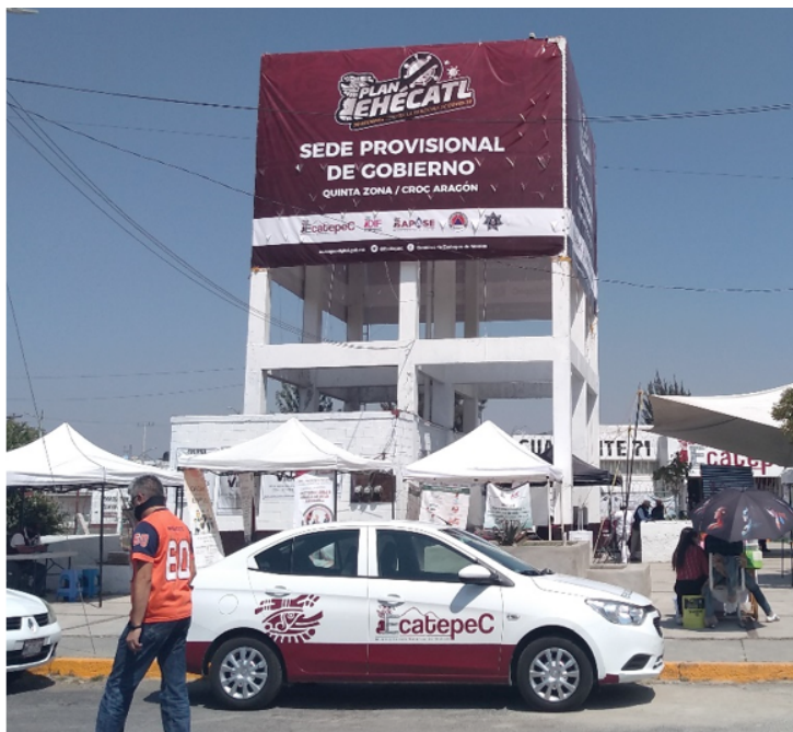
Figura 4. Sede provisional Gobierno de Ecatepec

La falta de agua, el contexto de la contingencia sanitaria, el llamado del presidente para revisar el suministro y la falta de respuesta por parte del Gobierno estatal, llevaron a la utilización del espacio como una herramienta política. En este proceso, la Quinta Zona, en particular la colonia CROC de Aragón, se convirtió en un espacio de poder. Siguiendo la orden del Presidente municipal, se estableció una sede provisional del municipio en la explanada de dicha colonia, justo encima de la cisterna que almacena el agua y al lado del tanque elevado que proporciona el suministro (Figura 4). Lo que parece ser un gesto simbólico.