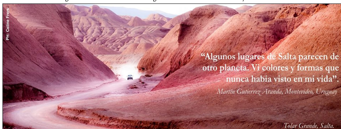
Imagen 1. Tolar Grande. Publicidad gráfica del Ministerio de Cultura y Turismo de Salta