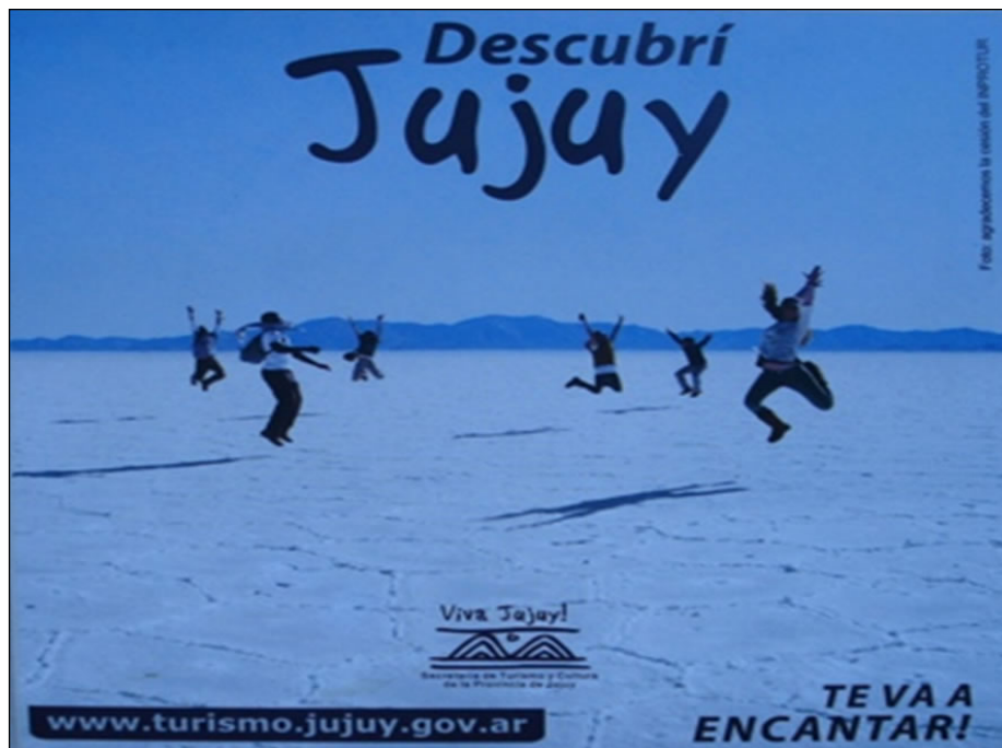
Imagen 2. Portada folleto Secretaría de Turismo de Jujuy (2012)