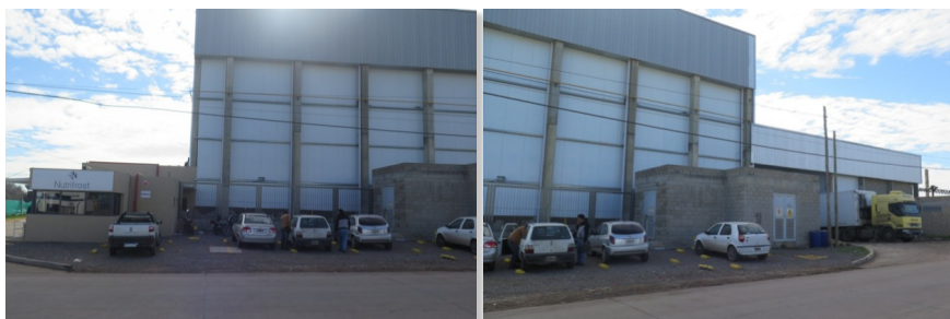
Fotografía 5. Planta de Nutrifrost en el Parque Industrial Pilar