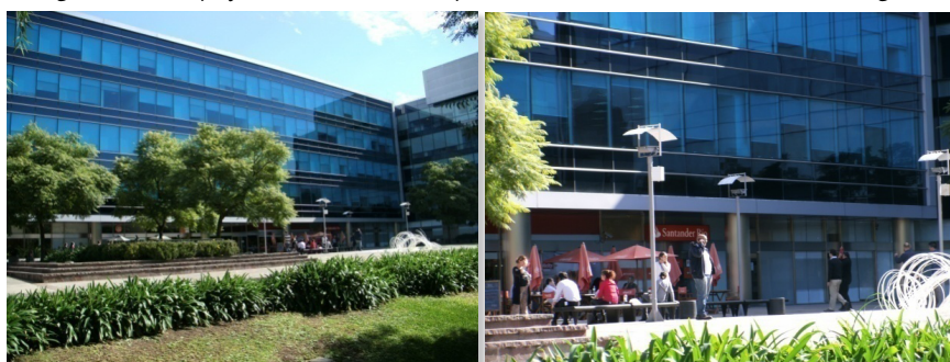
Fotografía 3. Complejo Urbana, Vicente López, donde BRF instaló su sede central argentina