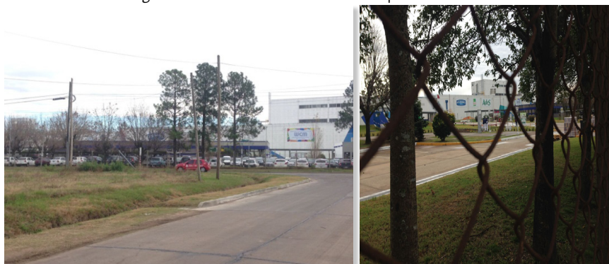
Fotografía 4. Planta de Unilever en el Parque Industrial Pilar