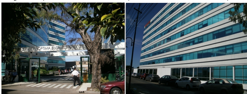
Fotografía 2. Optima Business Park, Vicente López, donde Unilever tiene su sede corporativa