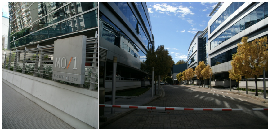
Fotografía 1. Complejo Master Office, Vicente López, donde Nestlé posee sus oficinas centrales