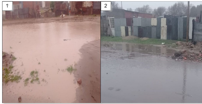
Fotografías 1 y 2. Anegamiento en el barrio Villa Talleres

Nota: calles anegadas en el barrio Villa Talleres luego de la ocurrencia de precipitaciones intensas, subidas a la red social Facebook por vecinos del sector. En la Fotografía 1 se observa la acumulación de agua en las calles de tierra y el barro que impide el tránsito vehicular y peatonal. En la Fotografía 2 se observan los materiales deficitarios de construcción de las viviendas, mayormente de chapa.