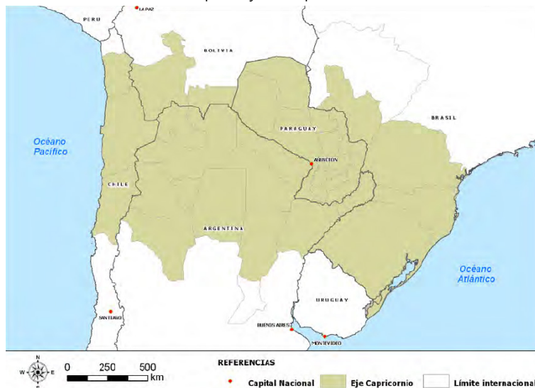
Mapa 1. Eje de Capricornio