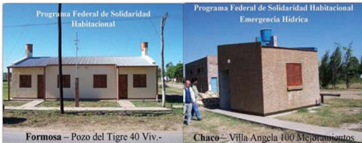
Figura N° 2. Viviendas construidas en el marco del Programa Federal de Solidaridad Habitacional