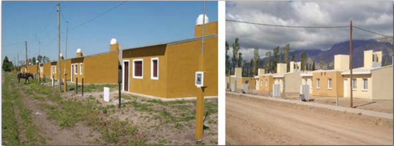
Figura N° 1. Viviendas construidas en el marco de los Programas Federales de Vivienda

Referencias: derecha San Juan - 2014; izquierda Santa Fé - 2008